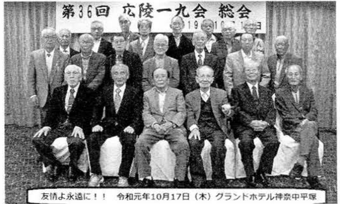
友情よ永遠に！！ 令和元年10月17日（木）グラントホテル神奈中平塚